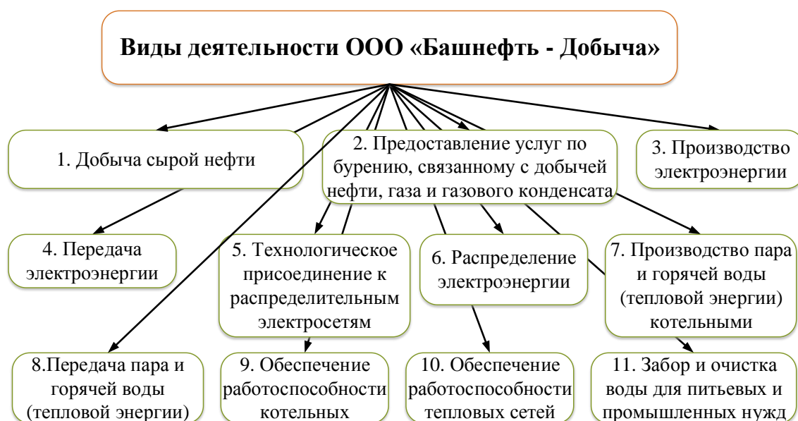
Рисунок 1.2 – Дополнительные виды деятельности предприятия

Основным видом деятельности является предоставление услуг в области добычи нефти и природного газа, также работает еще по 34 направлениям, некоторые из которых представлены на рисунке 1.2 [3].