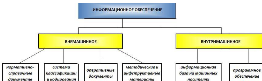
Рис. 2. Состав информационного обеспечения

Информационное обеспечение – это совокупность информации, полученной из различных источников и хранящейся в системе в виде базы данных, а также программ обработки данных и внешнее ИО, позволяющее провести идентификацию объекта управления, формализовать информацию, представить данные в виде документов (рис. 2).